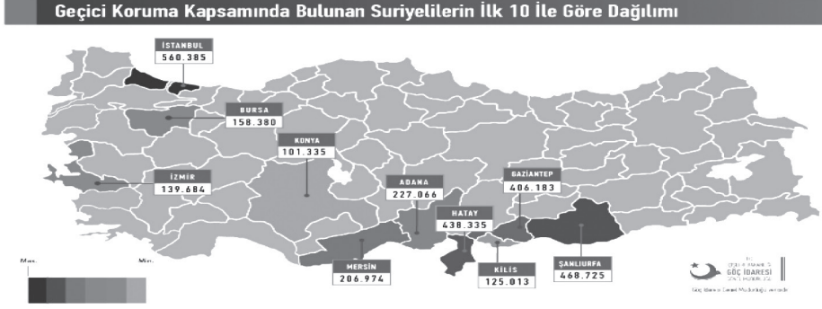
Tablo-3: Geçici Koruma Kapsamında Bulunan Suriyelilerin İlk 10 İle Göre Dağılımı